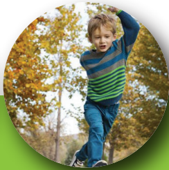
Mueve continuamente sus manos y pies