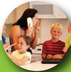
Interrumpe a otros y no puede esperar su turno