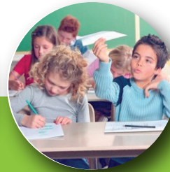
Se distrae jugando