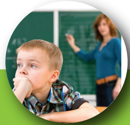
No presta atención a detalles

Es una condición médica en la que los niños tienen dificultad para prestar atención por largo tiempo, son muy inquietos y pueden ser impulsivos.