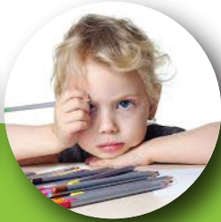
Es descuidado en sus actividades cotidianas