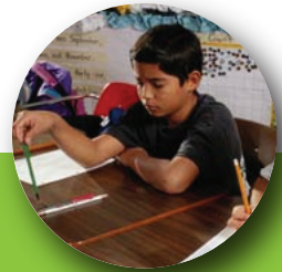
Se distrae fácilmente