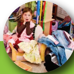
Pierde objetos como el material de la escuela