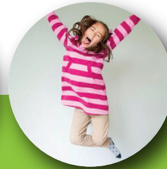
Corre o salta mucho en momentos no adecuados